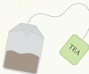
čaj v sáčcích